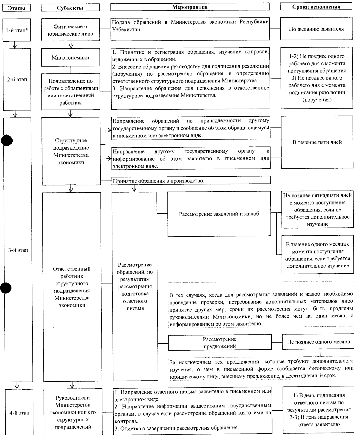
СХЕМА работы с обращениями физических и юридических лиц в Министерство экономики